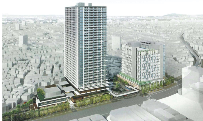
※写真右側の建物(13階)が庁舎棟